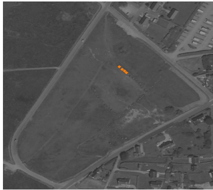
( ex. : alignement de menhirs)