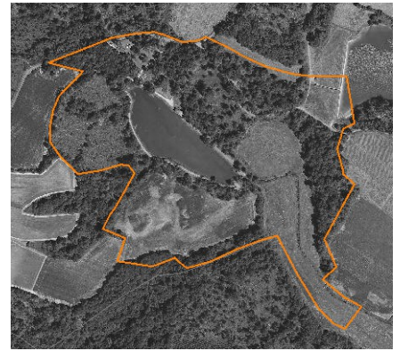
(ex. : parc remarquable)