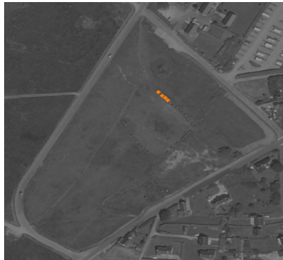
( ex. : alignement de menhirs)

Pour cette servitude, le générateur et l'assiette se superposent et se confondent.